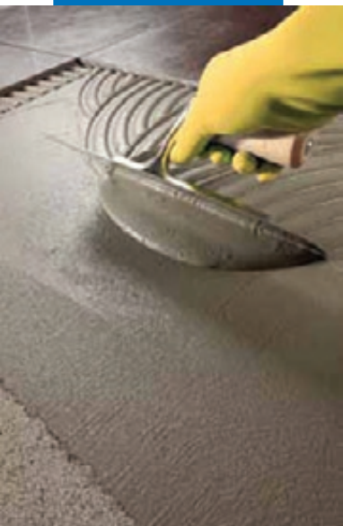
Укладка плитки на Kerabond T-R на пол