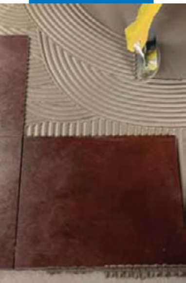
Укладка керамической плитки на стену